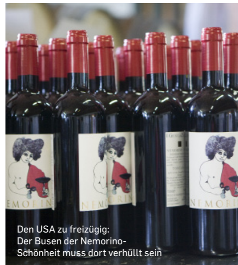
Den USA zu freizügig: Der Busen der Nemorino- Schönheit muss dort verhüllt sein

so der Name des Weines. Ein Frauenkopf, die lockige Haarpracht besteht aus dunklen Traubenbeeren, schaut mit großen Augen etwas nachdenklich und traurig auf den Betrachter – bittersüß, eben Dulcamara. Das Etikett stammt von Ettore Sottsass, einem der bekanntesten Designer Italiens. Aber nicht nur das Etikett, auch