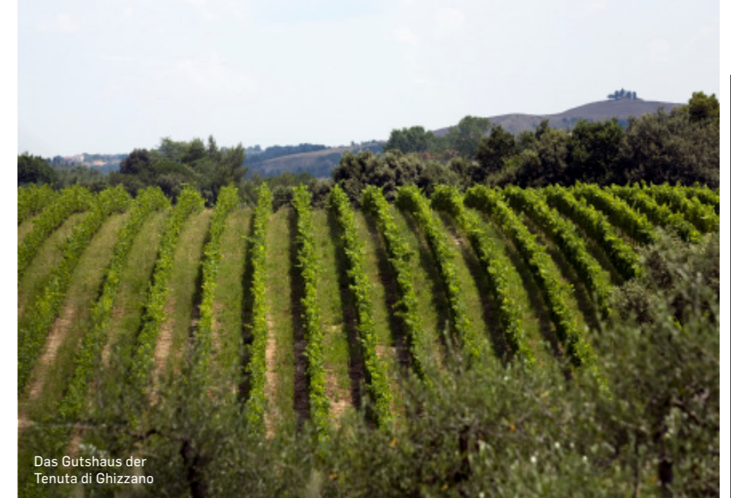
Das Gutshaus der Tenuta di Ghizzano