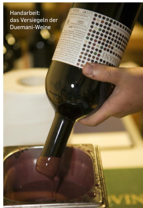
Handarbeit: das Versiegeln der Duemani-Weine