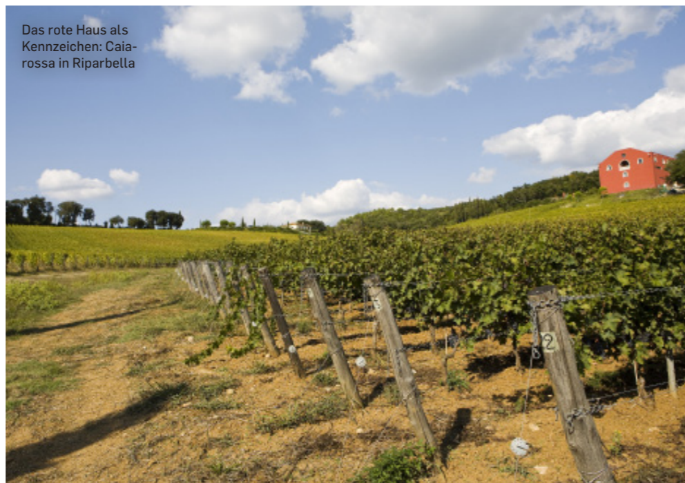
Das rote Haus als Kennzeichen: Caiarossa in Riparbella